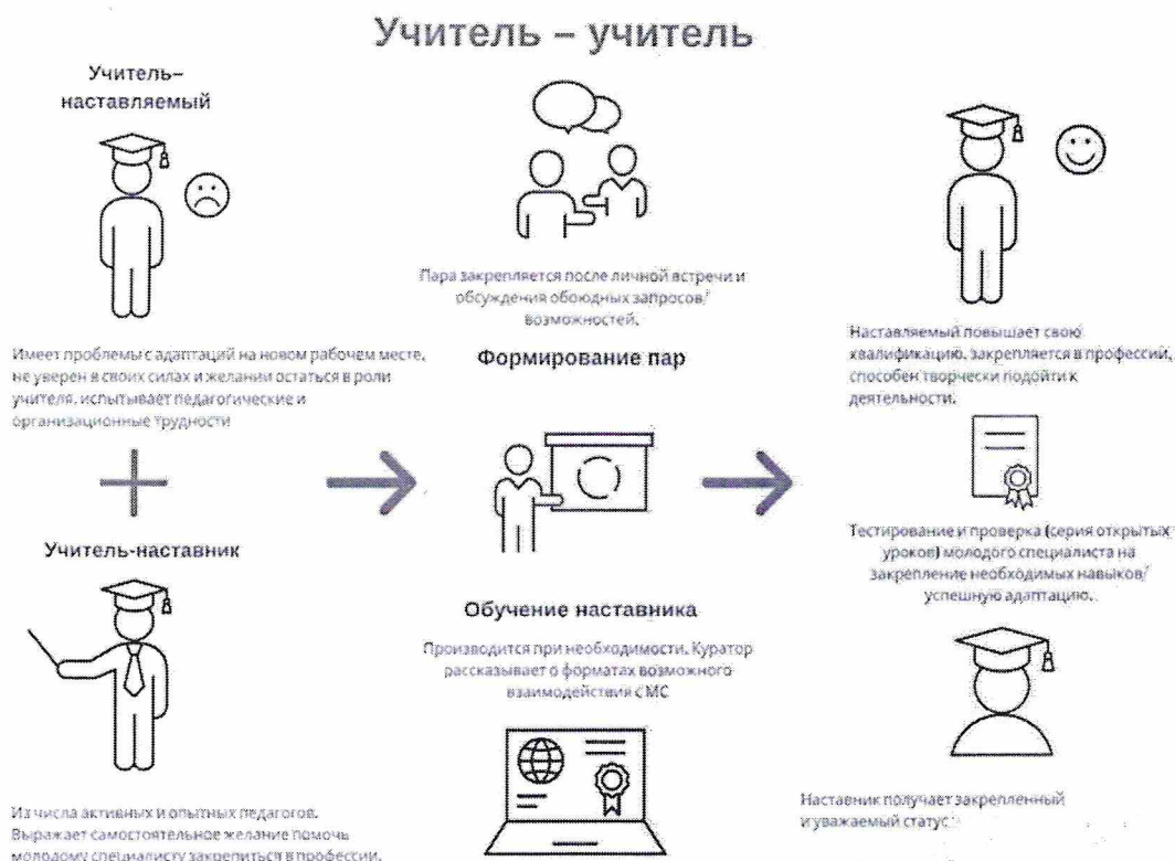
Рисунок 3. Графическое представление взаимодействия по форме «учитель-учитель»