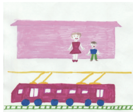
«Мы ждали трамвай» Рис. Агомяна Антона