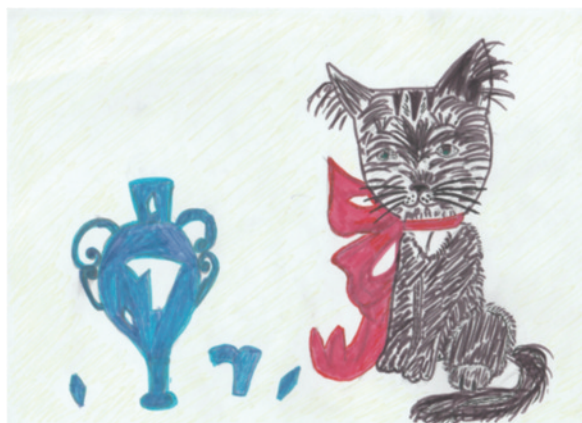
«Мне было стыдно перед Фишером» Рис. Королёвой Алины

Когда я была одна дома, я случайно разбила мамину любимую вазу. Я очень испугалась, что мне достанется от мамы. И вот когда мама вернулась домой и увидела в мусорном ведре осколки вазы, я побледнела от страха и, сама не знаю почему, указала пальцем на нашего озорного кота. Мама рассердилась на него и сильно отругала кота, даже шлепнула его газетой. Бедный Фишер, так зовут моего кота, не мог понять, за что его наказали. Он смотрел на меня испуганными глазами. В этот момент мне стало очень жалко Фишера и стыдно за обман. Я рассказала маме правду и попросила прощения. Мама меня простила. Той ночью я долго не могла уснуть, мне было очень стыдно перед Фишером и мамой. Я постараюсь больше никогда не обманывать своих родных и близких!